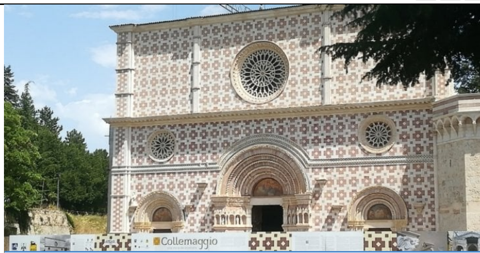
▲ La Basilica di Santa Maria di Collemaggio all'Aquila. Premiato l'intervento di restauro

Il rapporto di Symbola e Fassa Bortolo: con più di 2 miliardi investiti, l'Aquila è il più grande cantiere di restauro d'Europa