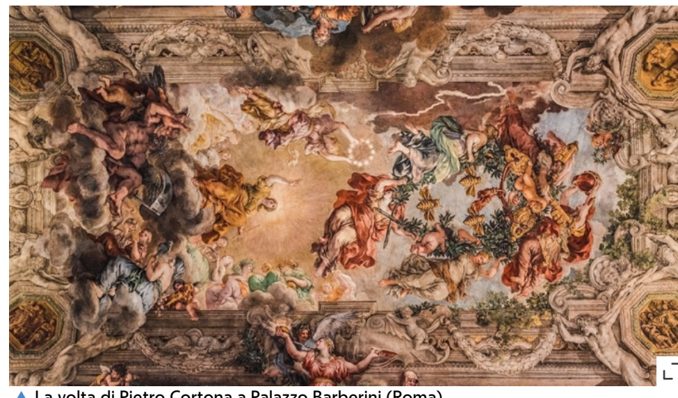
▲ La volta di Pietro Cortona a Palazzo Barberini (Roma)

Nel rapporto si dà spazio alle tante realtà che stanno sperimentando materiali e tecnologie per rendere più efficienti gli interventi di recupero: dalla scannerizzazione della volta di Pietro da Cortona a Palazzo Barberini (la seconda volta più grande a Roma, dopo la Cappella Sistina) grazie al laser scanner 3D a colori sviluppato da ENEA, all'illuminazione della Cappella degli Scrovegni a Padova a cura di iGuzzini illuminazione, leader nel settore dell'illuminazione architetturelle.