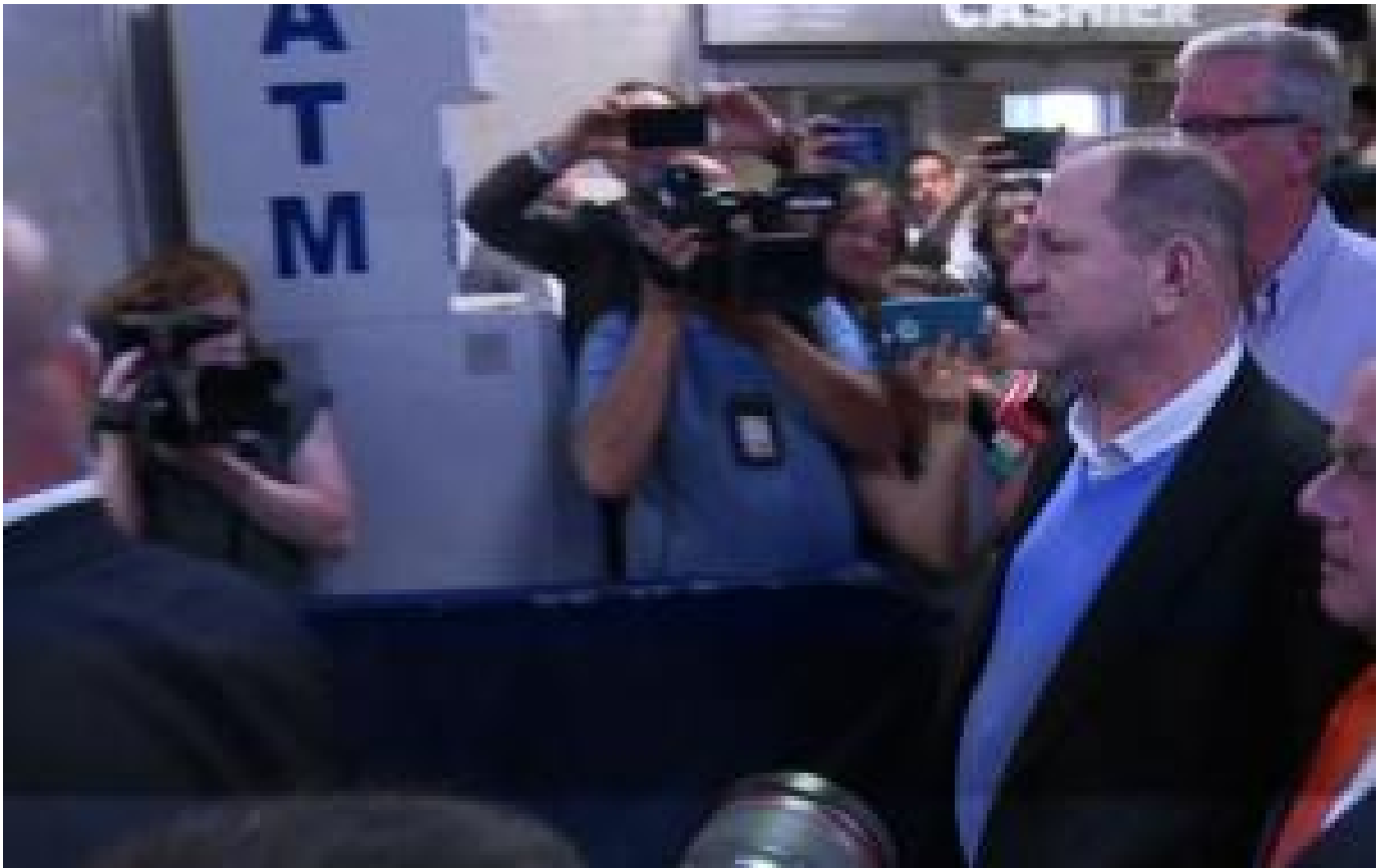
Harvey Weinstein incriminato per stupro da grand jury di New York (/video/2018/05/31/harvey-weinstein-incriminato-per-stupro-da-grand-jury-di-new-york-20180531_video_10585076)