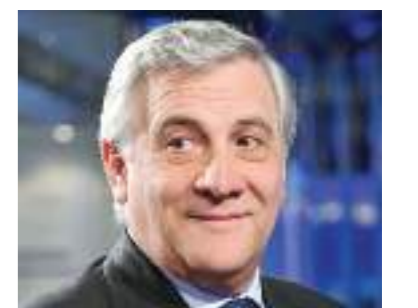
La valorizzazione economica è possibile: serve una visione intelligente e rispettosa Antonio Tajani PRESIDENTE DEL PARLAMENTO EUROPEO