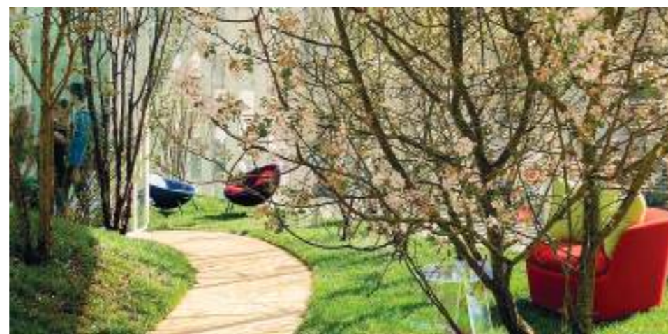
Modello internazionale. Dal 2017 il design ha anche una giornata mondiale, il 2 marzo: all'estero il sistema viene promosso dal progetto Italian design day voluto dal ministero degli Esteri.

I numeri del successo. Coinvolte oltre 29mila imprese che occupano 48mila persone, un sesto del totale degli addetti europei. Nel 2016 i nuovi diplomati sono stati 7094, in crescita del 9% cento