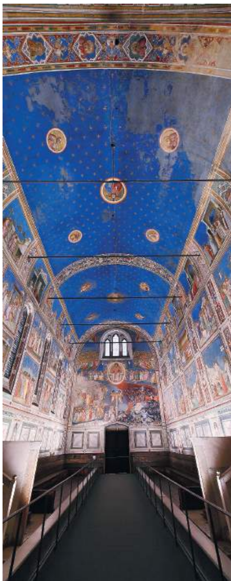
Luci smart. L'impianto realizzato da iGuzzini per la Cappella degli Scrovegni si fonda su un sistema di illuminazione dinamico che adatta le luci artificiali della Cappella al modificarsi delle condizioni ambientali

Nelle Marche. Dopo il terremoto la sfida di aziende, atenei ed istituzioni