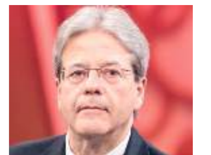
La cultura prospera se riusciamo a connetterla con tutte le forze vitali del nostro sistema-Paese Paolo Gentiloni