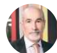
Presidente Gianfranco Tonti, presidente di Ifi Industrie, azienda fondata a pesaro nel 1962, specializzata nella progettazione e realizzazione di sistemi d'arredo per gli operatori professionali di food&beverage

Intervista/1. Antonio Tajani (presidente del Parlamento europeo)