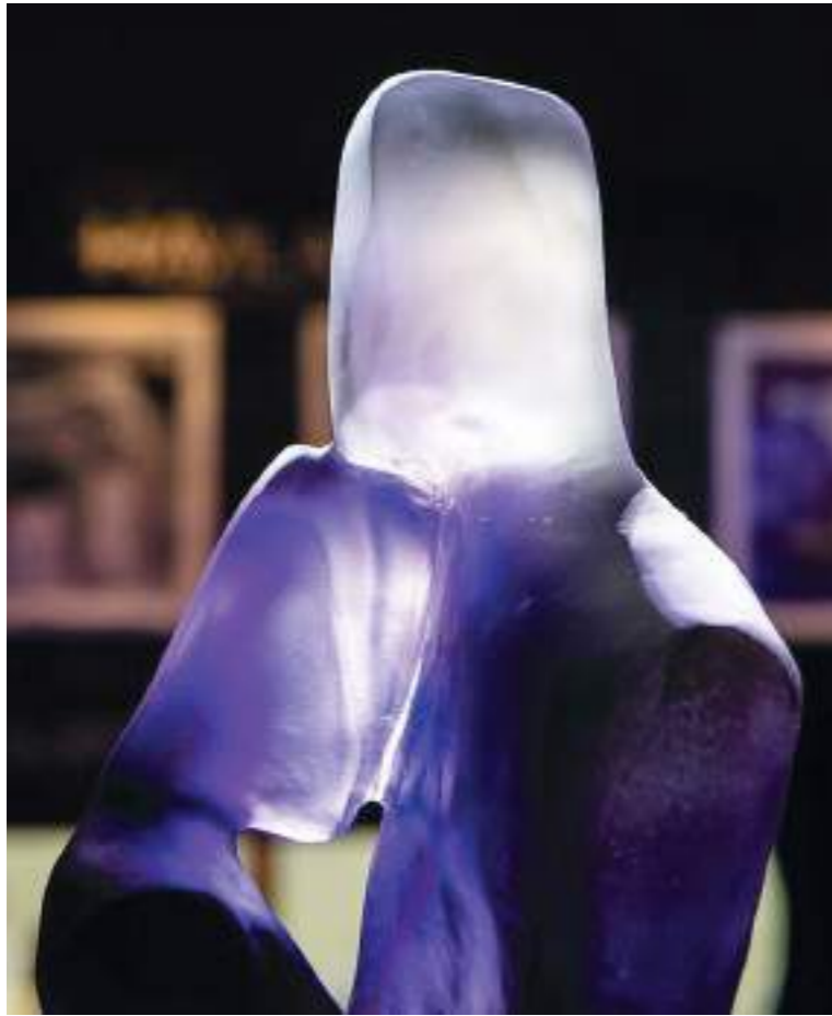
I luoghi della creatività. Con Salone, giunto alla 57esima edizione, e Fuorisalone, Milano è diventata la Capitale di questo sistema: qui hanno la loro sede un quarto delle imprese del settore

Il sistema. Un settore di eccellenza che genera lo 0,3% del Pil italiano e che cresce grazie alla collaborazione e alla sinergia di più parti dalle istituzioni, alle imprese, ai centri di ricerca presenti su tutto il territorio