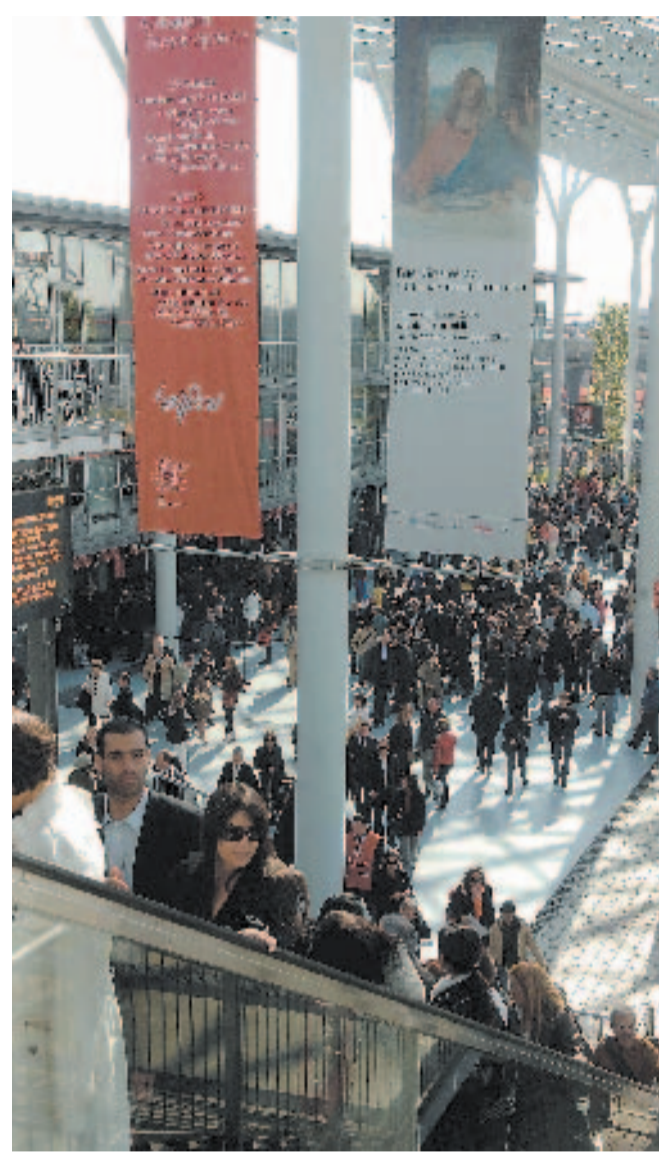
Rho-Però. Il polo milanese ospita una settantina di rassegne all'anno